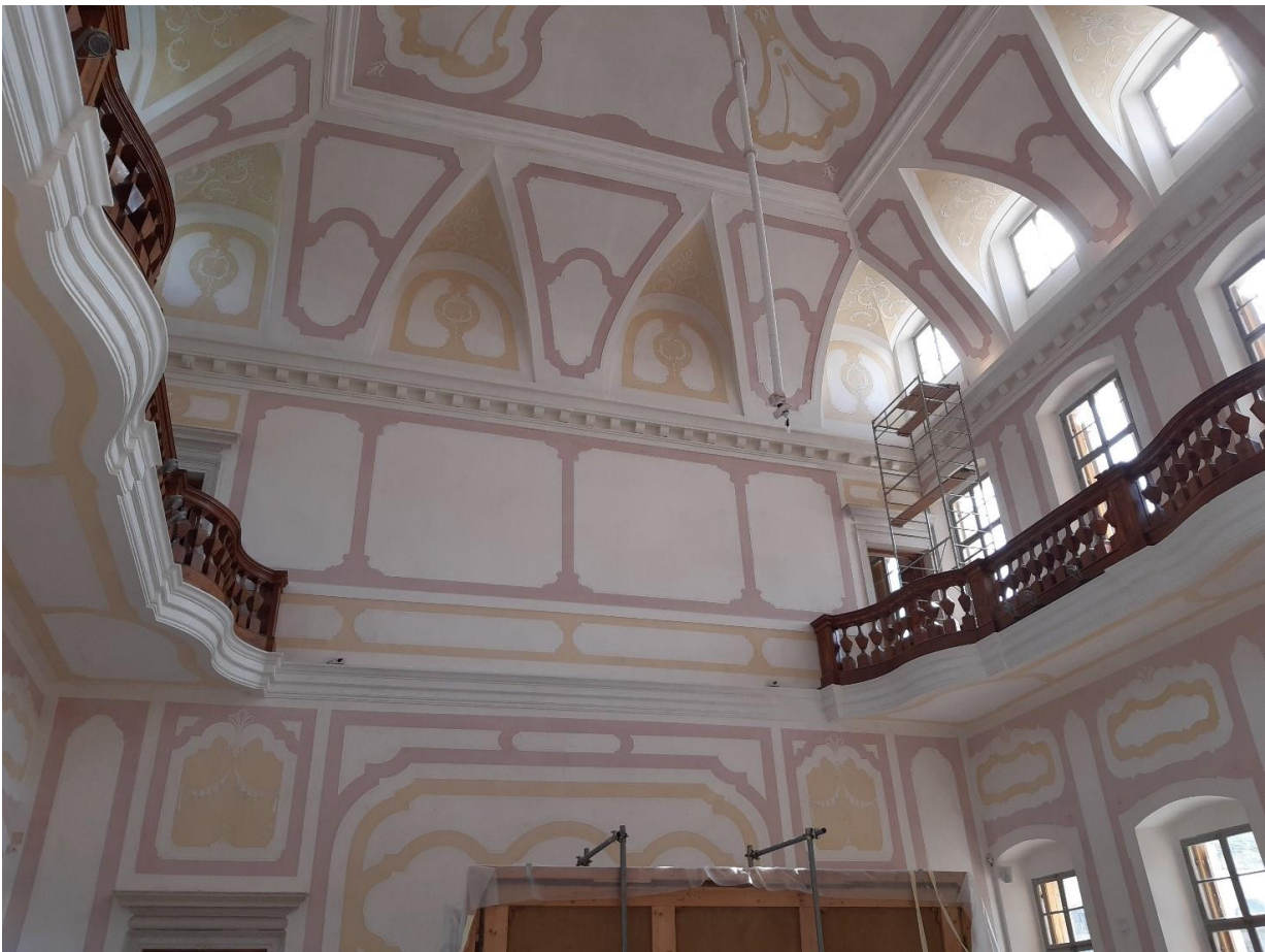
Salone centrale Villa Manin

https://www.giornatavillevenete.it/grand-pass/