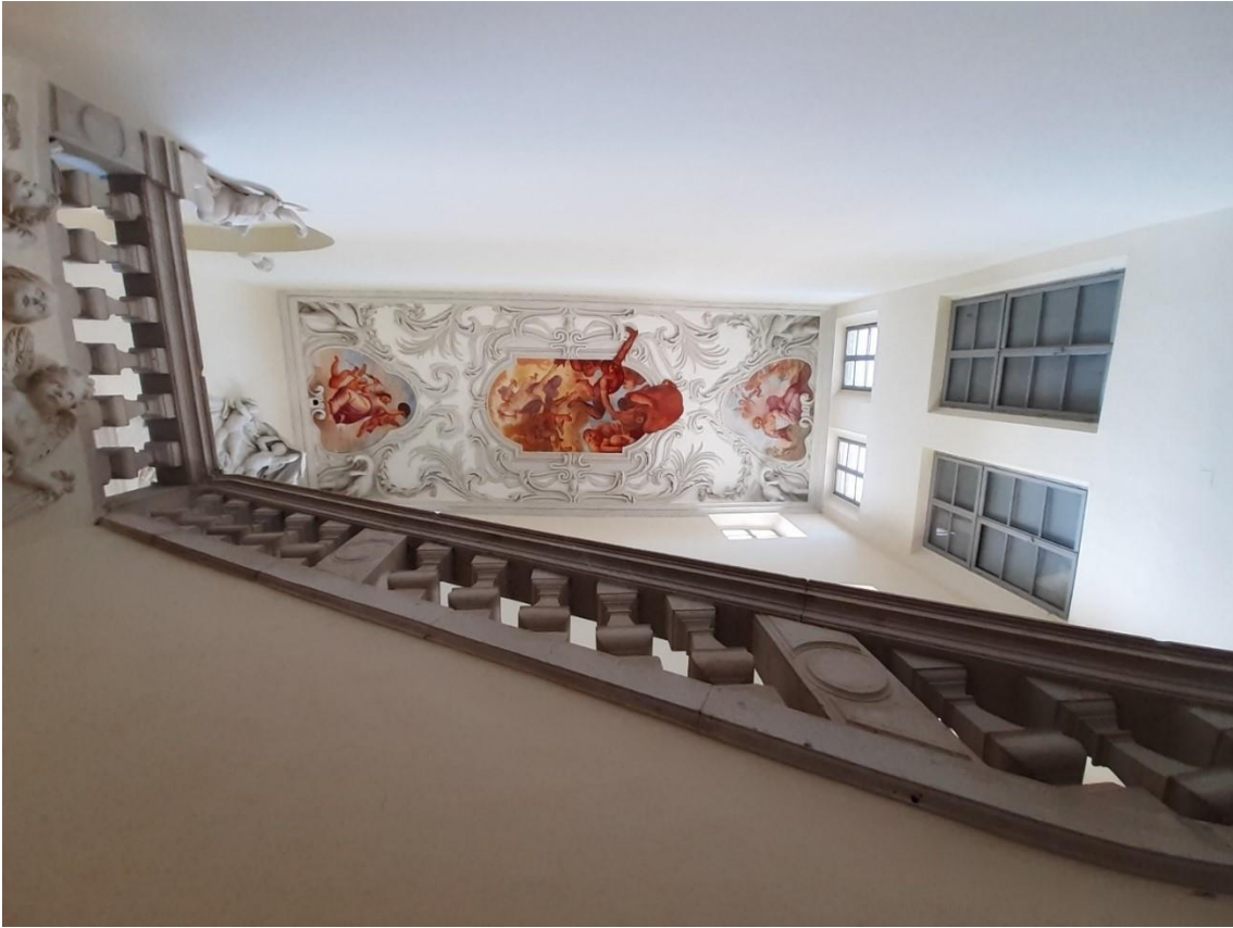
Scalone monumentale di ponente di Villa Manin